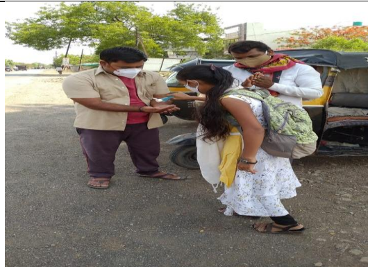
Students Distributing Masks and Explaining the Covid Guidelines