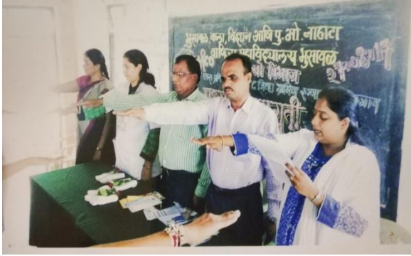
A protective pledge taken about AIDS