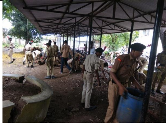
Cleaning Camps by NCC Unit at Various Places