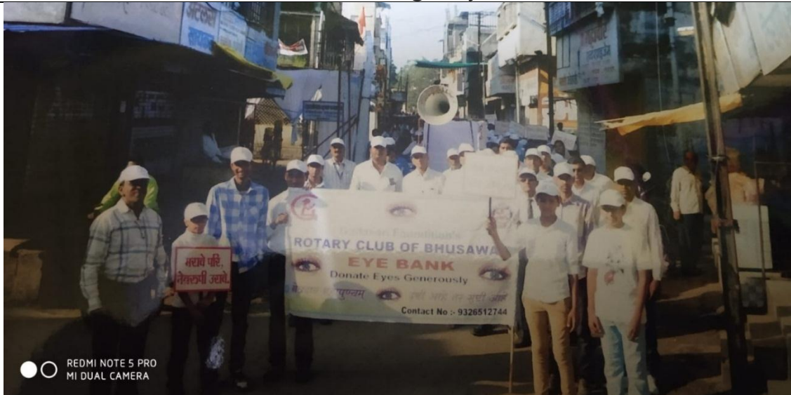
Eye Donation Rally by NSS Unit 'Marave Pari Netrarupi Urave'