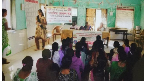
Health officer during guidance on Sicker Cell Anemia