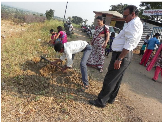
Varioud Activities by Economics Dept. at Mahadev Mal Village