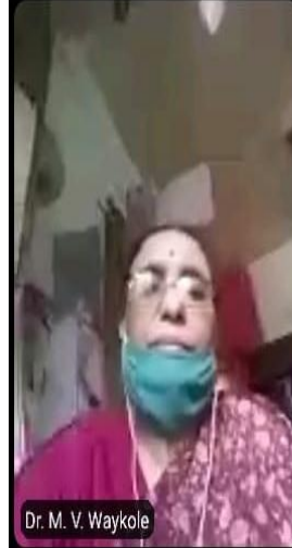
Online Webinar on Effective ways of Stress Elimination