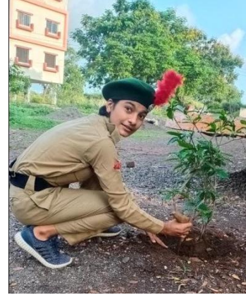
Tree Plntation Activity by Students and Teachers