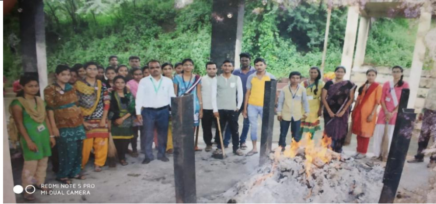
Chalo Smashan (Cemetery) Bhumi Abhiyan