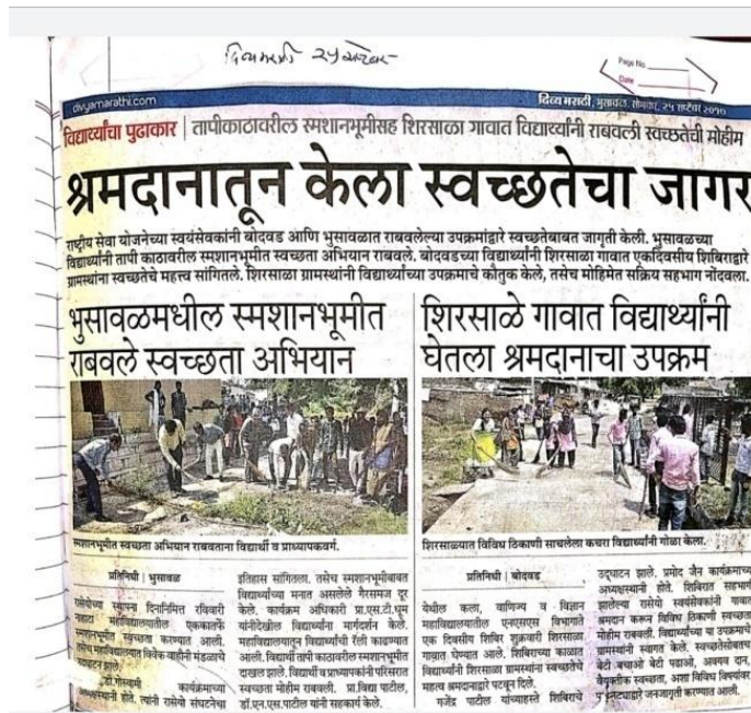
NSS Students Performing Street Plays and Cleaning Village Premises