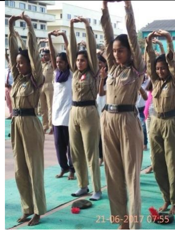
World Yoga Day